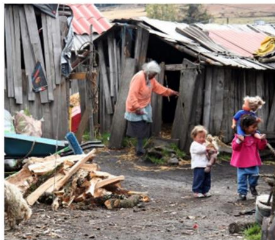
Pobreza y marginación, una preocupante realidad en el sur del país.

El reporte establece que la pobreza conculca el ejercicio de otros derechos sociales básicos: