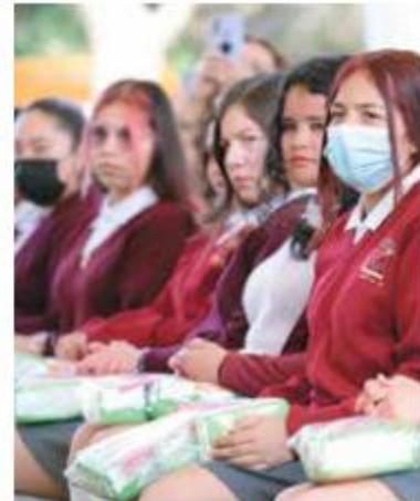
REPARTO. Se darán insumos y pláticas a las estudiantes.

A cada una de las 36 mil alumnas de sexto de primaria hasta bachillerato se entregarán 50 toallas sanitarias al año; habrá también 3 mil copas menstruales para ba-