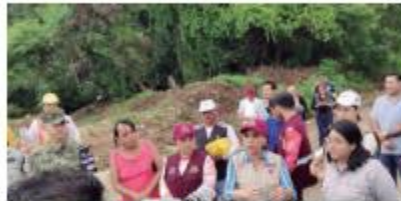
LA GOBERNADORA Mara Lezama recorrió varias zonas del estado, ayer.

Durante la mañana de ayer, por medio de sus redes sociales, la mandataria quintanarroense anunció que la navegación ya quedó abierta a embarcaciones turísticas en Bacalar y en los puertos de Chetumal,