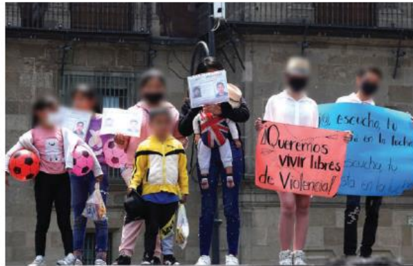
MARCHA de las infancias en el Zócalo de la Ciudad de México el 30 de abril del 2022.

violencia familiar 100 por ciento; abuso sexual, 50 por ciento; corrupción de menores, 30 por ciento...Ocho de cada diez familias ya no dejan salir a sus hijos a las calles por la inseguridad; mil 200 niñas y niños llegan al mes a los hospitales por lesiones y, entre todo eso, de cada 100 carpetas de investigación donde ellas y ellos son víctimas, sólo tres alcanza algún tipo de sentencia o proceso. Hay 97 por ciento de impunidad y eso habla sólo de los delitos denunciados, no aquellos que no sabemos", abundó.