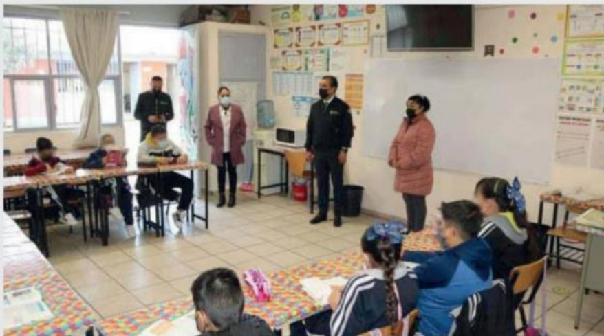
Se exhortó a la comunidad educativa a reforzar medidas sanitarias. Especial

L uego de que el pasado 9 de enero se estableció el regreso a clase de forma híbrida al concluir el periodo vacacional de invierno para priorizar la salud de las niñas, niños y adolescentes, el pasado jueves tras una evaluación y con base a la estadística de contagios por coronavirus durante la semana, por acuerdo de las Secretarías de Salud y Educación, se determinó que el lunes 16 de enero existen las condiciones para estar al 100 por ciento en clases presenciales.