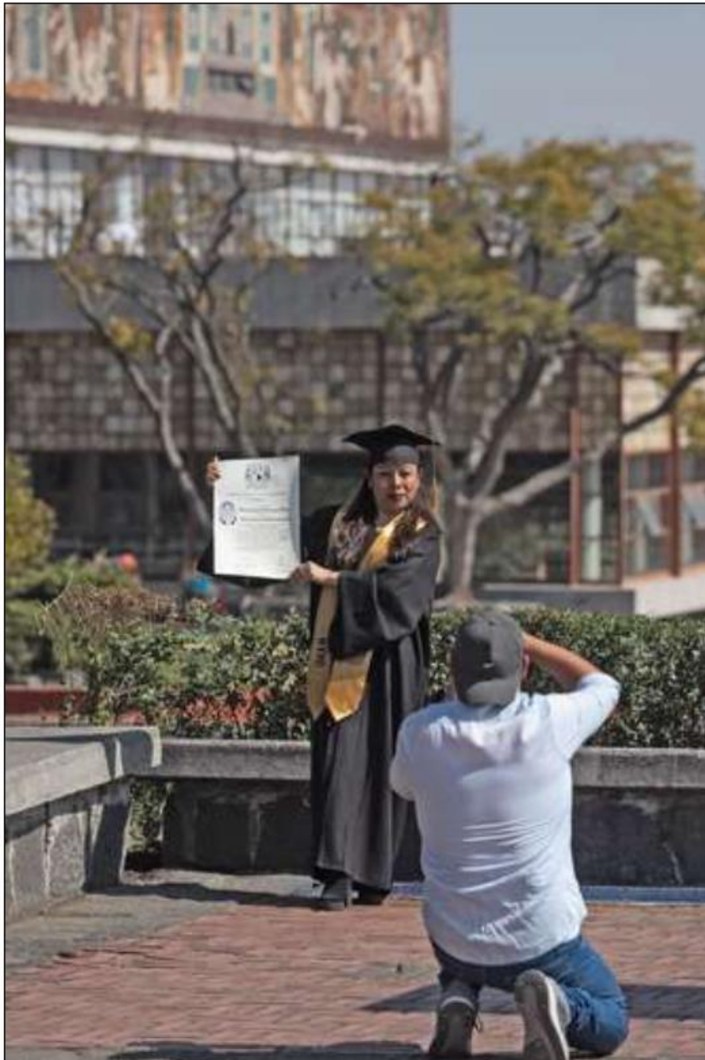
▲ Una recién egresada de la licenciatura en administración posa para una sesión de fotos a un costado de la torre de Rectoría.