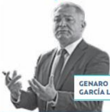
GENARO GARCÍA LUNA

Lo testificado la mañana del lunes por Sergio Villarreal Barragán , alias " El Grande ", en el juicio contra Genaro García Luna , exsecretario de seguridad pública en México del 2006 al 2012, puso en alerta a la clase política mexicana y en el caso de la Cuarta Transformación, nos dicen, ya activaron las antenas para ir señalando a más exfuncionarios que trabajaron en los gobiernos de Felipe Calderón Hinojosa y Vicente Fox Quesada , entre 2000 y 2012.