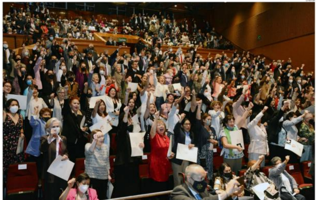
En el acto se entregaron 83 medallas a destacadas universitarias.