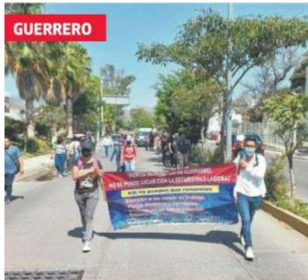
Con marcha en Chilpancingo, egresados de la normal Rafael Ramírez exigen asignación de plazas