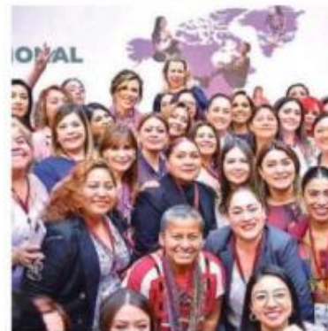
La mandataria señaló que aún existen brechas por superar