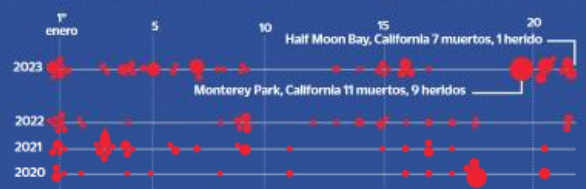
*Tiroteo con al menos 4 víctimas (sin contar el tirador), entre heridos y fallecidos

Especialistas estiman que solo el país es culpable, al surtir de armas a todo el mundo y no tener legislaciones para inhibir las grandes cantidades de armas que se manejan en el mercado negro y que se reflejan en violencia