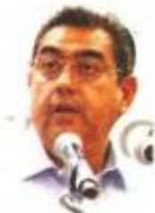
Sergio Salomón Céspedes

:::: Donde sigue la depuración, nos cuentan, es en Puebla, pues el gobernador Sergio Salomón Céspedes (Morena) está cambiando a los que fueron colaboradores del finado Luis