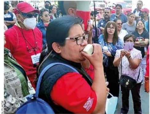
NEGOCIACIÓN. Miembros del sindicato señalaron que sólo lograron poner 17 acuerdos sobre la mesa.

Resaltó que en un principio la Rectoría se negó a la negociación en tanto no fuera notificada oficialmente, y que además no había recursos, por lo que el sindicato acudió a diferentes instancias sin