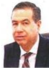
Ricardo Mejía Berdeja

:::: El que salió con la espada desenvainada, nos platican, fue Ricardo Mejía Berdeja durante su toma de protesta como candidato del