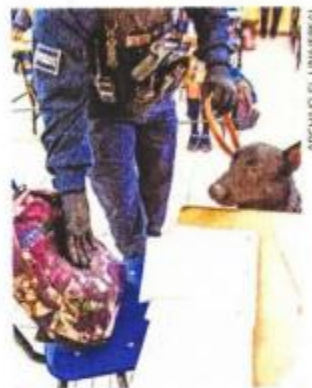
Los servidores públicos tienen la obligación de prevenir el consumo de drogas, dice SEP.

Los estudiantes recibirán materiales impresos, infografías, audiovisuales y recursos gráficos para reforzar las sesiones con los maestros frente a grupo