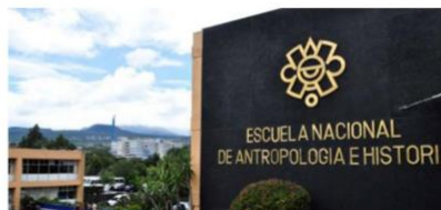
La Escuela Nacional de Antropología e Historia.