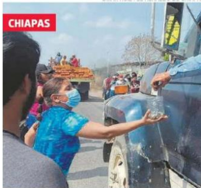
Con boteo , estudiantes del Tecnológico de Cintalapa siguen su paro; piden la destitución de la directora