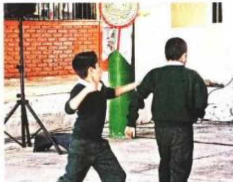
El Estado debe responder y proponer la forma de detener el bullying , dijo la Codhem.

por bullying ha recibido la Codhem en este año.