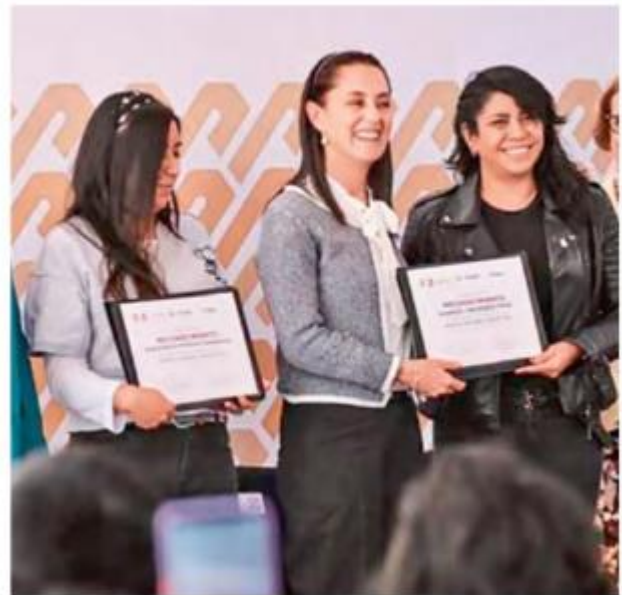
APOYO. Clases gratuitas a jóvenes interesados en continuar sus estudios.

En tanto, el titular de la ADIP, José Peña mencionó que actualmente la Escuela de Código es una de las más grandes de América