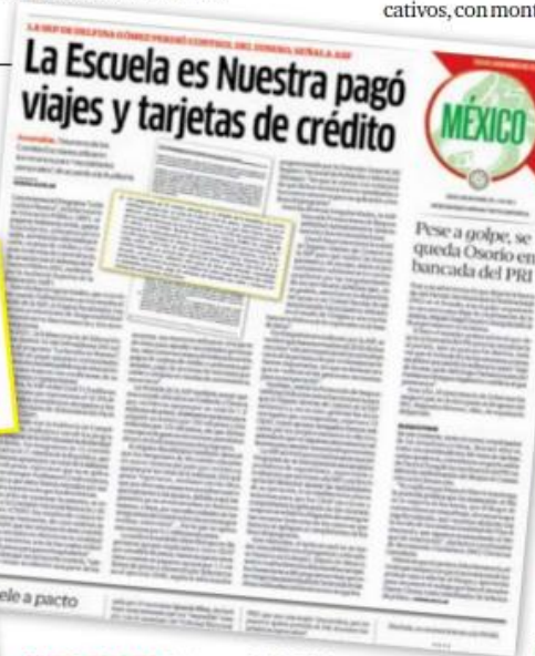
ANTECEDENTE. El viernes, 24 HORAS publicó sobre irregularidades al ejercer recursos del programa.

Debido a la pérdida de archivos y a que solo entregó expedientes de 32 planteles escolares beneficiados por La Escuela es Nuestra, la auditoría señaló que "la SEP no acreditó las obras de mantenimiento, rehabilitación o construcción realizadas en los 68 mil 665 planteles beneficiados por el programa en 2021 para la mejora de la infraestructura de los espacios educativos".