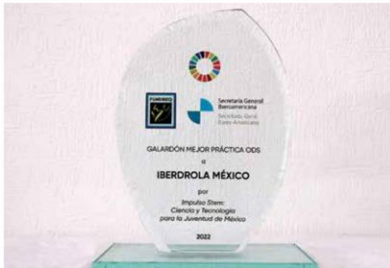
El reconocimiento por Impulso STEM se suma a los dos que obtuvo en 2021 por Luces de Esperanza y el Plan de Mitigación de Pandemia y Retorno Seguro al Trabajo.

bo del mundo: “Mi prioridad es ayudar a pasar del uso de las energías tradicionales, que vienen haciendo daño a nuestro planeta, a las energías renovables, que en México no se han desarrollado tanto como en otros países.