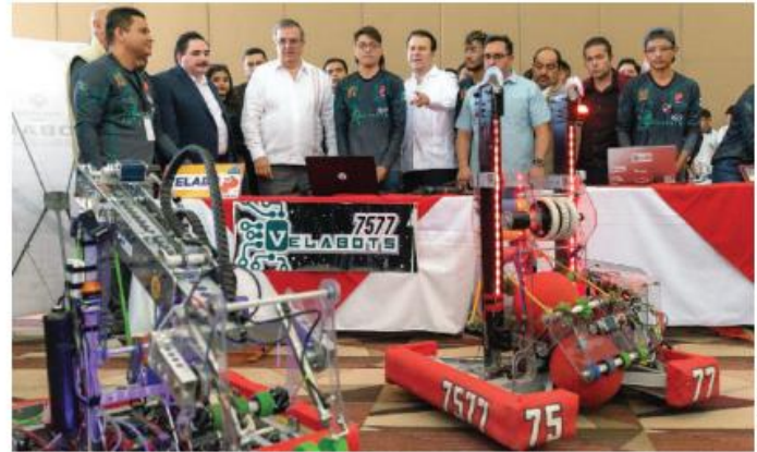
EL GOBERNADOR Esteban Villegas (5° de der. a izq.) y el canciller Ebrard (7°, ayer).

"Gobernador y jóvenes cuenten con el apoyo del Gobierno federal, en Durango se tienen muchos recursos para participar", apuntó el canciller, al mencionar que se está impulsando al estado en el mapa de las inversiones, para atraer empresas que generen empleos mejores pagados, para evitar que los jóvenes