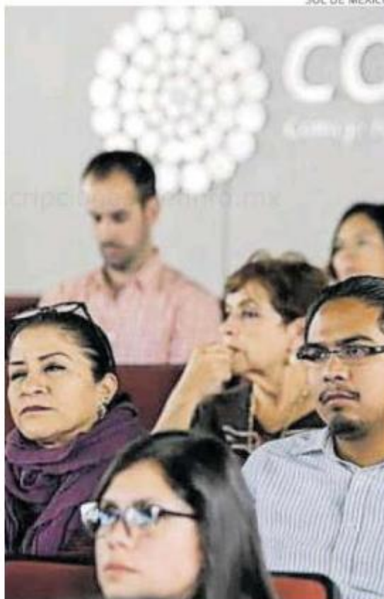
Lo programan para el 2 de mayo.