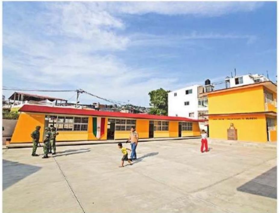
La Escuela Primaria Francisco I. Madero es una de sus obras construidas en Guerrero