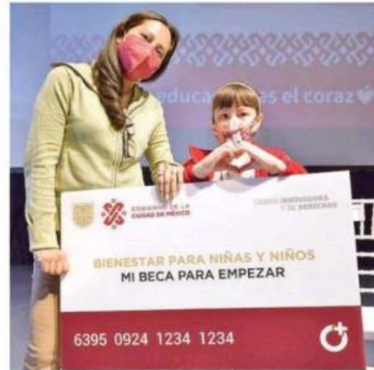
Con estas acciones, el GCdMx apoya el ingreso familiar, contribuye a erradicar la deserción y refuerza el aprovechamiento académico

Los montos mensuales en CdMx serán de 600 pesos para alumnos de preescolar, 650 pesos para los de primaria y secundaria y 600 pesos a los inscritos en Centros de Atención Múltiple