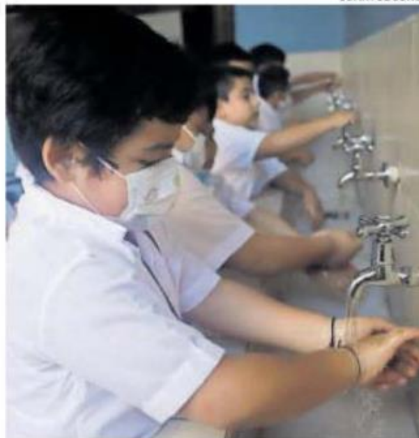
Que están seguros los niños.