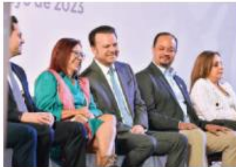
EL GOBERNADOR de Durango (centro) y la titular de la SEP (izq.) en el evento, ayer.