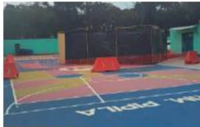
EL ÁREA destinada a la obra luce tapada en esta imagen, captada ayer.

El exhorto del titular de la Miguel Hidalgo se da luego que madres y padres de alumnos de este colegio manifestaran su molestia ante la intención de instalar esta