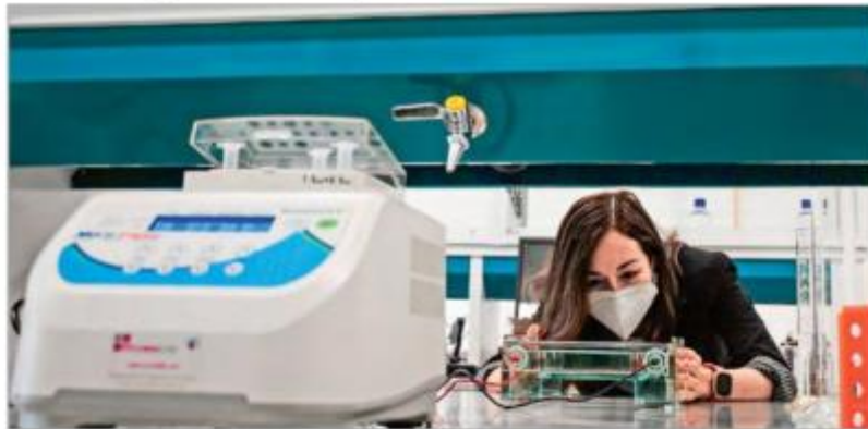
LABORATORIO. Investigadores y académicos externan su preocupación por el contenido y la manera en cómo se legisló y que puede afectar los proyectos.

Investigadores y académicos mexicanos mostraron su preocupación y descontento ante la aprobación de la Ley General de Humanidades, Ciencia, Tecnología e Innovación (LHCTI), debido a su contenido y el proceso en cómo se legisló.