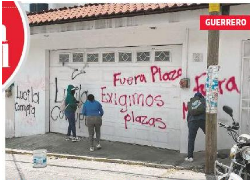
Egresados de varias normales y de centros regionales de educación vandalizaron oficinas administrativas en Chilpancingo para exigir 100 plazas