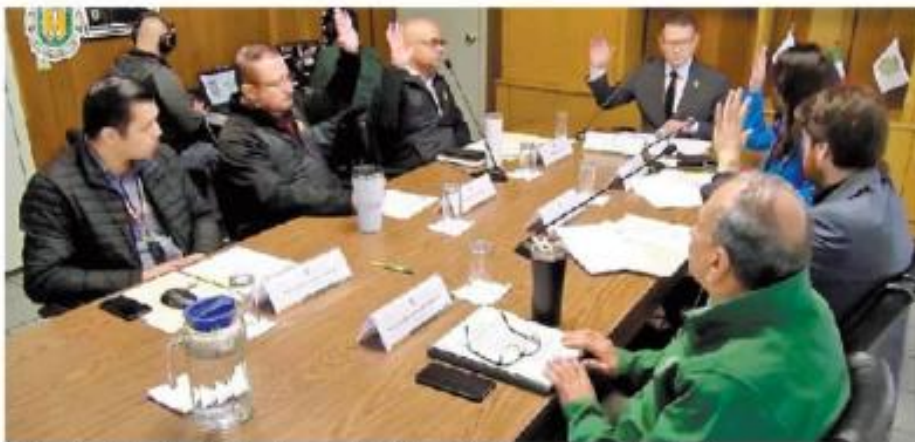
- Reunión. Se llevó a cabo la primera sesión del organismo en su formación actual.

titulares de la Secretaría General, de la Unidad Transparencia y Acceso a la Información Pública, de la Tesorería, de la Oficina de Planeación y Desarrollo Institucional, y de la Oficina del Abogado General. Además, se tiene como invitados permanentes a quienes tienen a su cargo la Auditoría Interna y la Jefatura de Transparencia, Protección de Datos Personales y Gestión Documental.