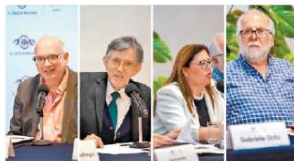
- Fuerza. La institución realiza cada año más de 300 actividades académicas y culturales.

Tras este evento, se inaugurará la exposición El Colegio Nacional: 80 años en 80 carteles , una muestra retrospectiva