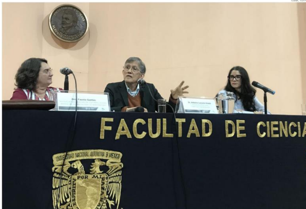
La Facultad de Ciencias de la UNAM llevó a cabo una mesa de análisis con la participación de los académicos.