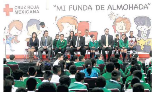
Alumnos de la Escuela Primaria General Antonio Rosales recibieron capacitación de la Cruz Roja sobre qué hacer en caso de incendios.

Con el proyecto Mi funda de almohada, se les entregará a los niños un cuaderno didáctico de prácticas con ilustraciones e historias con el que se pretende que los alumnos aprendan a conocer la importancia de estar preparados para actuar ante emergencias y con ello "salvar su vida, la de sus compañeros, hermanos y familiares".