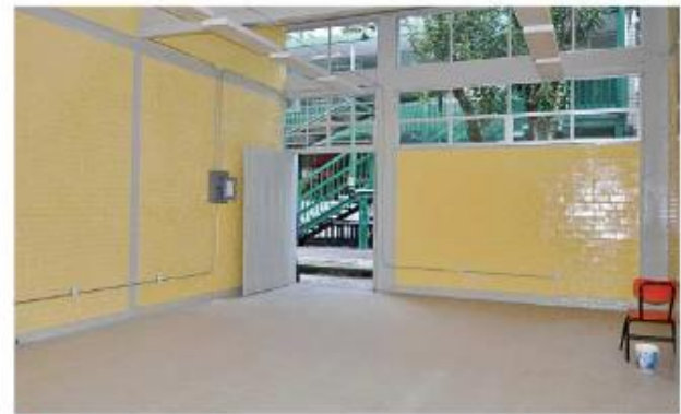
Además de nuevos módulos sanitarios, la escuela fue pintada y son sustituidas las redes de luz y de agua.

“Si no les dio tiempo de acabar en las vacaciones pues deberían de trabajar en las noches, los niños se están atrasando mucho y nadie nos da una respuesta”, reprochó Rosaura, madre de familia.