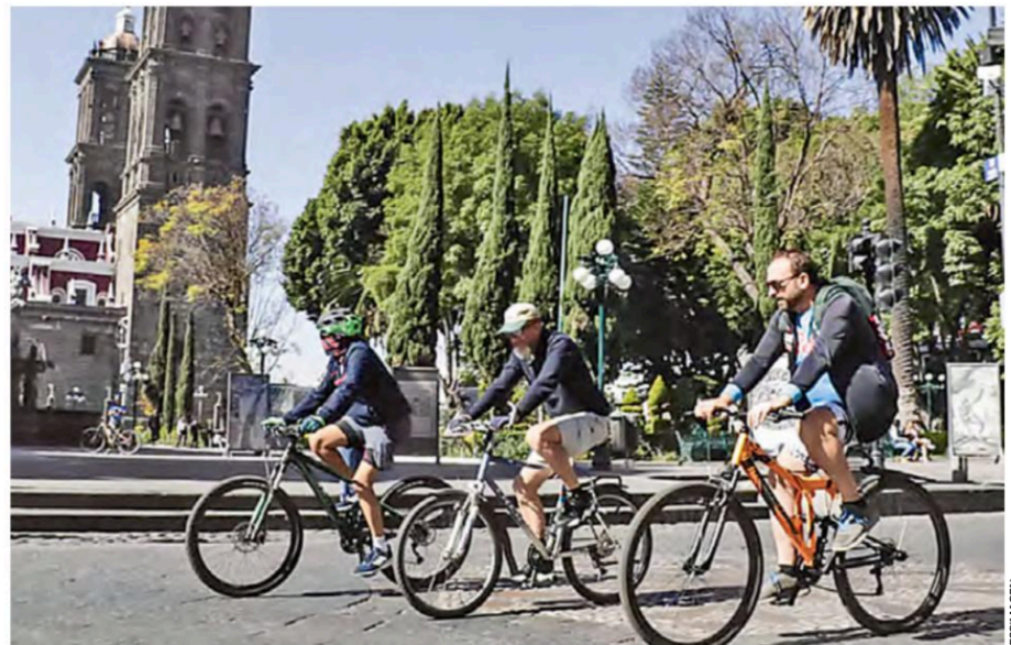
NORMALIDAD. Este domingo regresaron los paseos dominicales en la capital poblana.

Esta actividad dominical que reúne a familias que gustan del ciclismo, patinar, correr o de caminatas junto a sus mascotas, es organizada por el Instituto Municipal del Deporte y