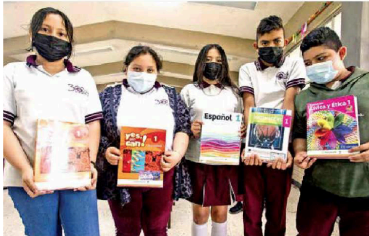
La UNPF reiteró su compromiso a favor de una educación de calidad.

de alumnos están en la incertidumbre por la polémica por los libros de texto gratuitos.