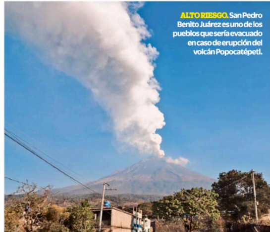
ALTO RIESGO. San Pedro Benito Juárez es uno de los pueblos que sería evacuado en caso de erupción del volcán Popocatepetl.

Bajo la misma etiqueta, se entregaron mil 409 millones de pesos a la Defensa Nacional (Sedena). Según información pública, el Ejército compró miles de colchones, estufas,