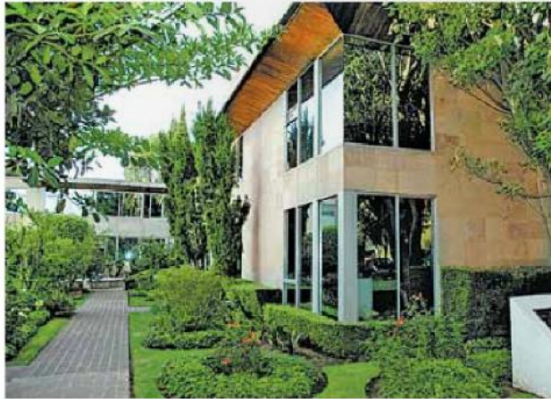
La Asociación busca apoyar el crecimiento de la educación superior.

“No obstante, para cumplir las metas de crecimiento de la matrícula y de mejora continua de calidad, entre otras, establecidas en el Programa Sectorial de