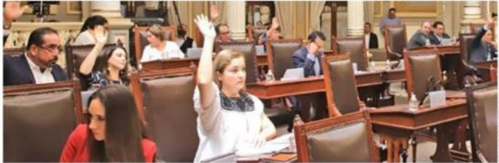
24 HORAS PUEBLA

Entre los cambios, los diputados aprobaron eliminar la edad máxima para ocupar el cargo de rector.