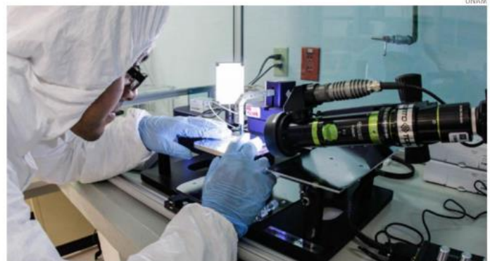
¿Cuál es la incidencia social de una investigación de ciencia básica?, es algo que muchos científicos deben contestar en la actual convocatoria.

de la comunidad, por lo que entienden y valoran su propuesta. No importa lo que diga el reglamento, las comisiones lo demostraron con la resistencia mos-trada el año pasado” •