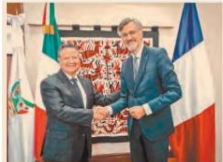
Menchaca Salazar agradeció el interés que tiene Francia por los proyectos educativos y económicos en la entidad.

También se cuenta con el Programa de Movilidad Internacional Estudiantil Mexprotec, iniciativa de la Cooperación Franco-Mexicana en el Área de la Enseñanza Profesional y Tecnológica Superior.