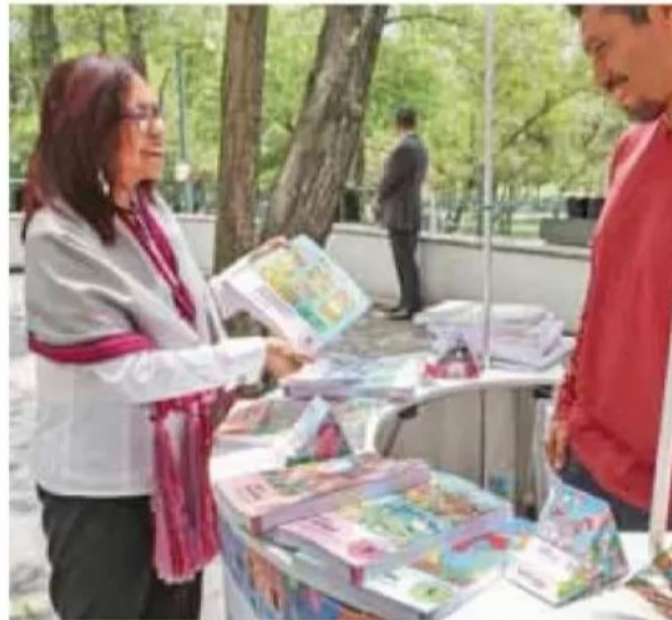
Libros. Autoridades desoyen las críticas de los opositores. /SEP

Cabe recordar que la comparecencia es un ejercicio de transpa-