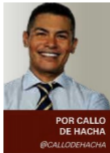
POR CALLO DE HACHA @CALLODEHACHA

Insisto, hay que ser ingenuo para no entender que todos los textos escritos en la historia de la humanidad, incluido este que usted está leyendo, tienen un sesgo ideológico.