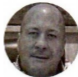
ENRIQUE ALFARO Gobernador de Jalisco

La oposición en San Lázaro anunció que buscará que la Suprema Corte frene la distribución, pues se "busca adoctrinar" a los niños. Leticia Ramírez, titular de la SEP, dijo que las críticas no son contra los