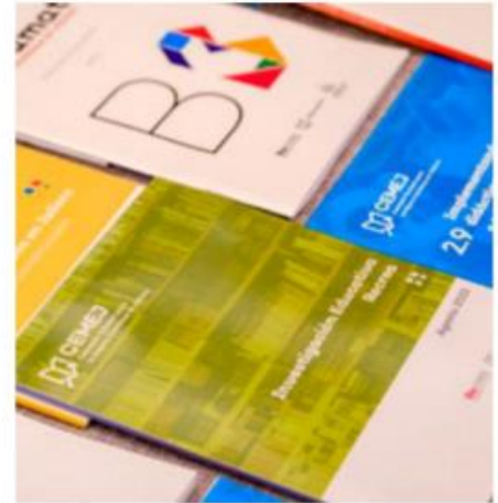
Jalisco ya tiene su material Recrea.

Debido a una suspensión provisional otorgada por el Poder Judicial de la Federación a