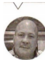
ENRIQUE ALFARO Gobernador de Jalisco

Precisó que la Nueva Escuela Mexicana especifica que 40% del programa se puede modificar dependiendo de las condiciones locales, por lo que pidió confiar en los maestros duranguenses que, aseguró, tomarán las mejores decisiones. ●