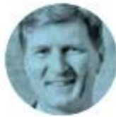
ENRIQUE DE LA MADRID

› Nadie acusó recibo del reclamo que hizo Xóchitl Gálvez entorno al respaldo que obtuvieron, de la noche a la mañana, algunos aspirantes presidenciales del Frente Amplio por México, pero fuentes cercanas a esa alianza, nos dicen que el reproche tenía como destinatarios a los perredistas Silvano Aureoles y Miguel Mancera . Y al panista Francisco Javier García Cabeza de Vaca , quien, en un abrir y cerrar de ojos, obtuvo una cascada de firmas de apoyo.