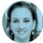
CLAUDIA RUIZ MASSIEU

› Resulta que no sólo se adelantó del 16 al 14 de septiembre la rendición de protesta de Delfina Gómez como gobernadora del Estado de México, sino que asistirá a la ceremonia el presidente López Obrador . El coordinador del equipo de transición de la morenista, Horacio Duarte , informó que el titular del Ejecutivo Federal tuvo una charla telefónica con la maestra, y le confirmó que estará con ella en el acto protocolario en el Congreso del estado.