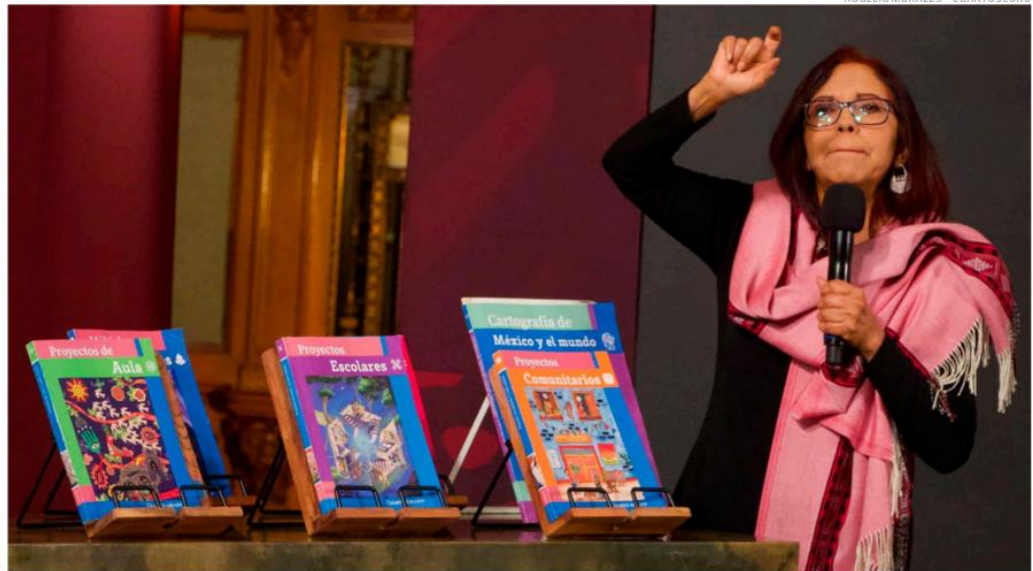
Leticia Ramírez, titular de la SEP, salió en defensa de los libros de texto gratuito.

“En el periodo de Chuayffet (Emilio, secretario de Educación en la primera etapa del gobierno de Peña Nieto), se encontraron 117 errores en el libro de texto, aunque estaba manipulado... ¿Este proceso en qué acabó?, ¿tuvieron que