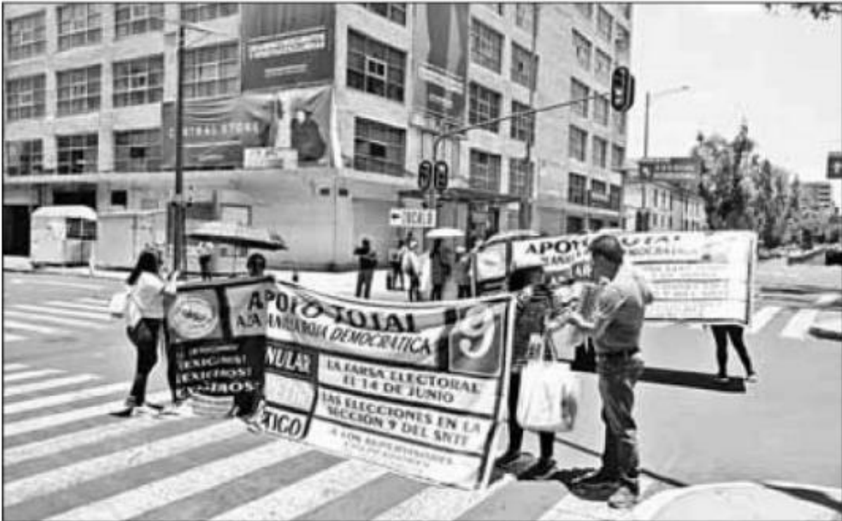
▲ Integrantes de la Coordinación de Maestros de la Región Oriente Iztapalapa, pertenecientes a la CNTE, bloquearon ayer la avenida