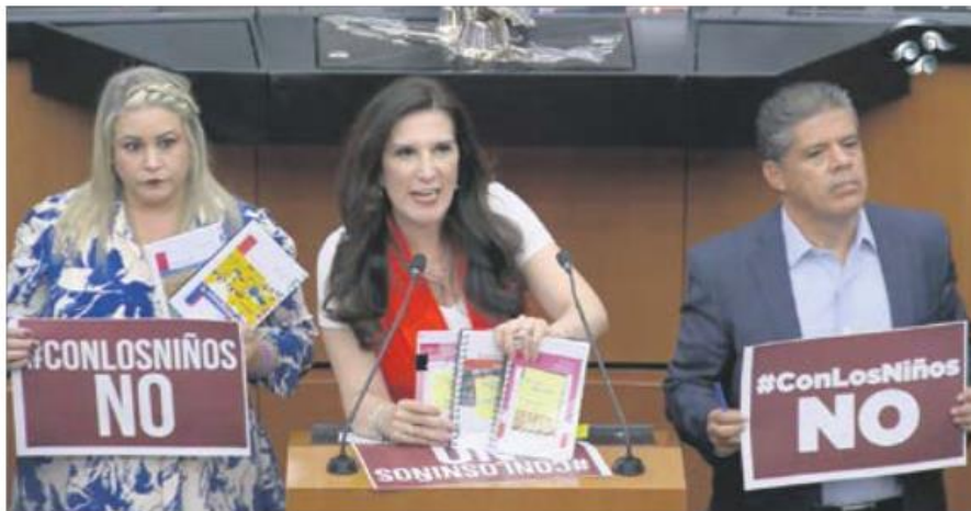
Exigencia. Legisladores de oposición, ayer, en el Congreso de la Unión.

Desde la tribuna de la Comisión Permanente del Congreso, diputados y senadores advirtieron también que son libros “tóxicos y chafas” que sólo “enseñan a odiar a la gente” con