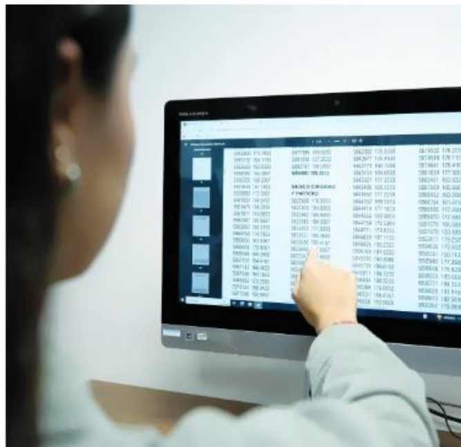
2023-B. Para el actual calendario entraron 19 mil 581 nuevos alumnos.

Las 10 carreras más demandadas fueron las licenciaturas en Médico Cirujano y Partero (7 mil 192 aspirantes), en Psicología (2 mil 802), en Derecho (2 mil