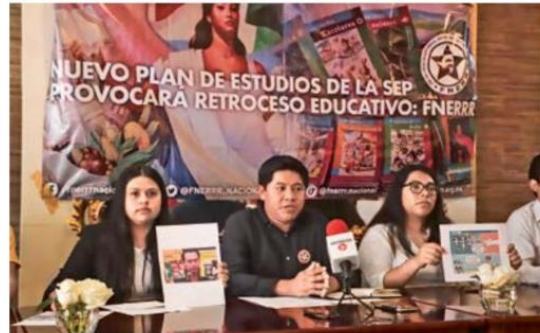
VISIÓN. La Federación de Estudiantes consideró que los contenidos no se ajustan al contexto actual del país, como tampoco engloba las necesidades de las aulas.

En este sentido, destacó que muchas escuelas carecen de infraestructura adecuada, de maestros suficientes, de acceso a internet, por lo que señaló que si se hace un cambio en el ámbito educativo, debe de contem-