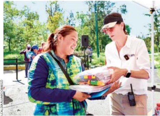
APOYO. La alcaldesa dijo que la entrega de los útiles escolares se realizará en todo Álvaro Obregón.

De los 17 mil paquetes de útiles escolares, 6 mil serán destinados para alumnos de primer y segundo grado de primaria, 6 mil para tercer y cuarto grado de primaria, y 5 mil para alumnos de secundaria, cabe