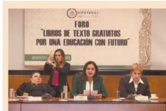
Las especialistas coincidieron en evitar la polarización que se ha evidenciado y arreciado con el tema.

Coahuila se suma a Chihuahua como los estados que han interpuesto recursos ante la Suprema Corte en contra de la distribución de libros de texto gratuitos.