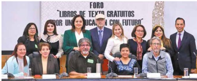
Llamado. Expertos, ayer, en un foro en la Cámara de Diputados.

Indicó que “no se cuenta con los materiales de apoyo para el maestro, las actividades son escasísimas”, por lo que “yo sugeriría a las escuelas que sigan con la práctica