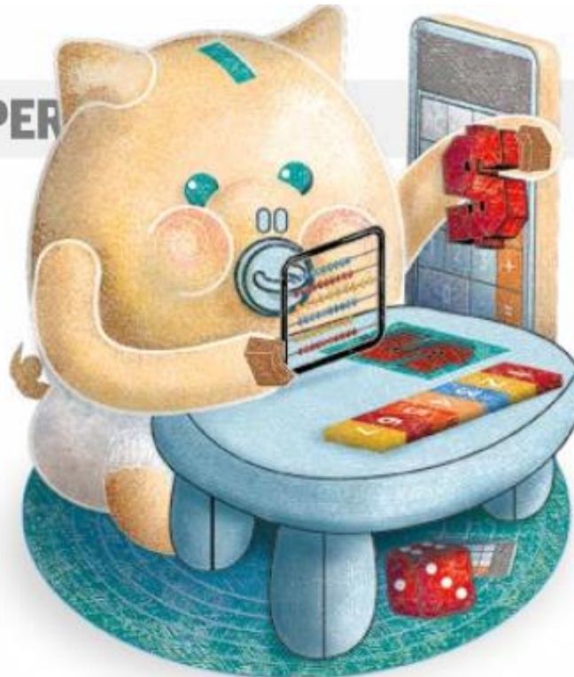
Ilustración: ESMERALDA ORDAZ

Asimismo, se señalan las tendencias a nivel global que subrayan la importancia de la educación económico-financiera, de acuerdo con la