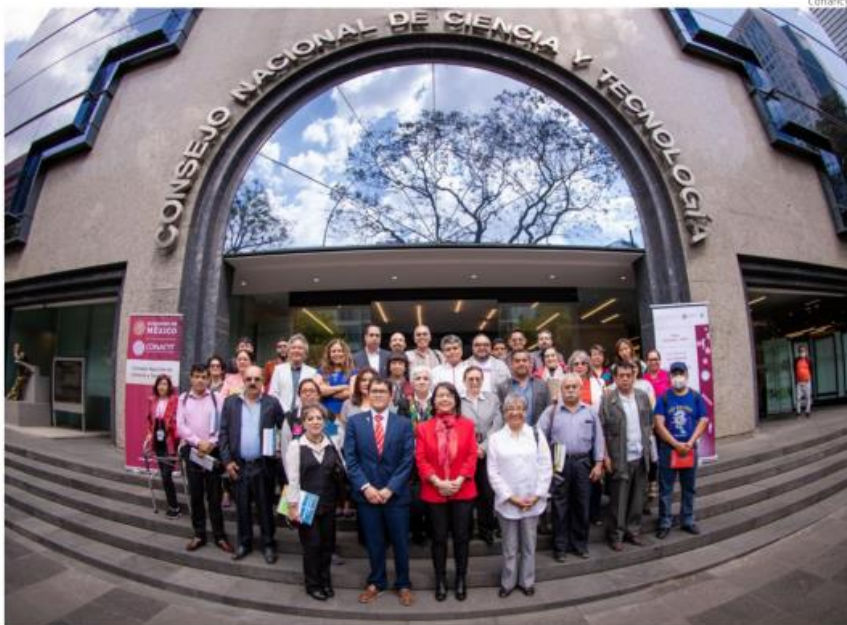
Conahcyt emitió un comunicado en el que insistió en que la Ley general de ciencia se mantiene vigente.

investigación (16.4%), de los cuales a la fecha están en revisión el 66.7%. El resto de programas se clasificaron como profesionalizantes y “no elegibles”.