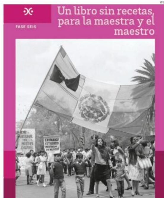
Portada de Un libro sin recetas, para la maestra y el maestro , sexto volumen.

Dentro de dos semanas se cumplirá medio siglo del asesinato del empresario Eugenio Garza Sada, en septiembre de 1973, cuando una célula de la Liga intentó secuestrarlo. El libro para