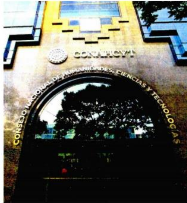
El Conahcyt reveló que de 3 mil programas de posgrado que integran el SNP, sólo 541 de universidades públicas y 21 de privadas son prioritarios.

Ante tal situación, miembros de la comunidad académica acusan falta de transparencia en los