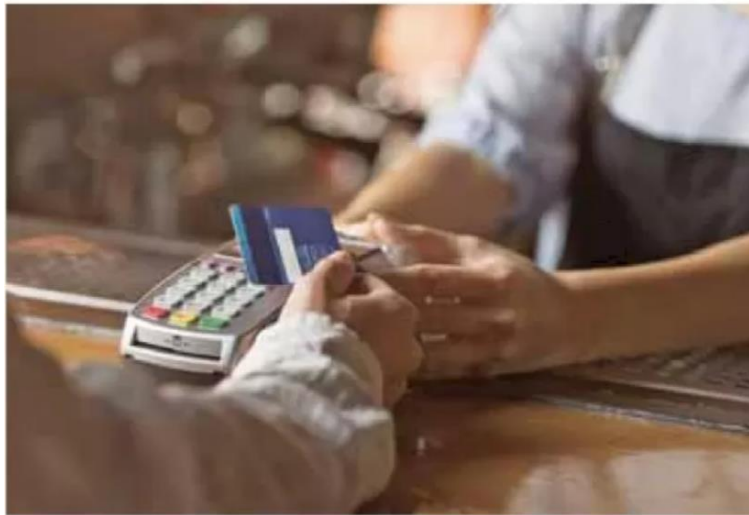
Actualización. La eliminación del dinero en efectivo es una tendencia a nivel global.

Modernidad. Los pagos electrónicos de colegiaturas se dispararon 490% en 2023, según reporta la plataforma Conekta, mientras que otras tendencias que llegaron con la pandemia se afianzaron