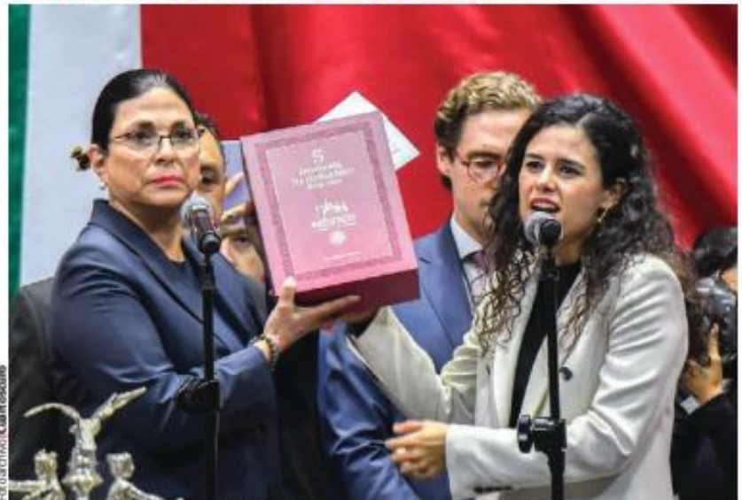
LA TITULAR de la Secretaría de Gobernación, Luisa María Alcalde, entrega el quinto informe de gobierno del Presidente Andrés Manuel López Obrador a Marcela Guerra, Presidenta de la Mesa Directiva de la Cámara de Diputados, el pasado 1 de septiembre.