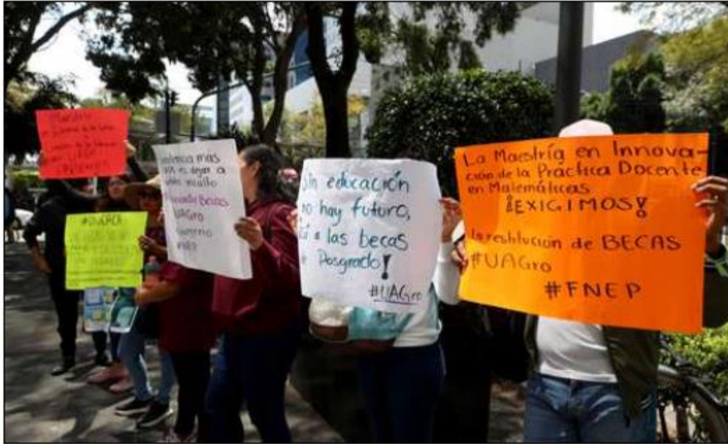
▲ Con un bloqueo en Insurgentes, alumnos de diversas universidades públicas y privadas se manifestaron ayer frente a oficinas del Conahcyt, en demanda de que se otorguen becas a todos los estudiantes de posgrado, sean o no miembros de programas prioritarios. ● Foto Alfredo Domínguez