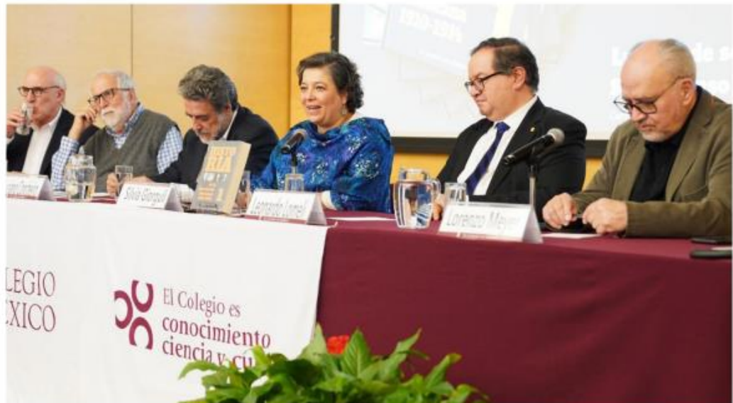
Los participantes en la presentación de "Historia de la Revolución Mexicana".

"Generó una enorme innovación en materia historiográfica en México, pero también provocó muchos rechazos y so-