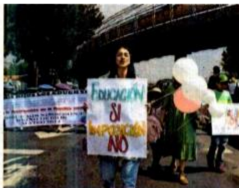
El Frente Nacional por la Familia se manifestó en la Cámara Baja en contra de los nuevos libros de texto.

60 mil FIRMAS han reunido en el país padres de familia a través de la plataforma Actívate.org.mx .