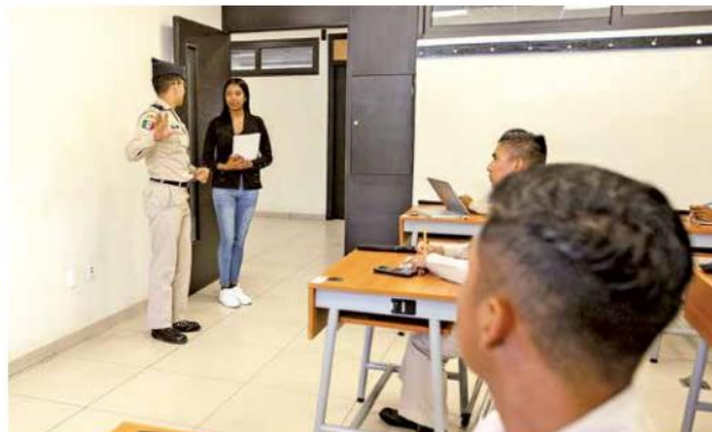
La Escuela Militar de Ingeniería ofrece seis carreras y seis especialidades.