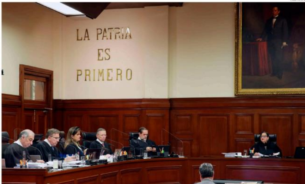
Joan Ochoa prevé que la Ley General de Ciencia será declarada inconstitucional debido al proceso legislativo y errores en sus artículos.

La Corte solicitó aplazar resolución de amparos hasta que los ministros resuelvan si la Ley General es constitucional