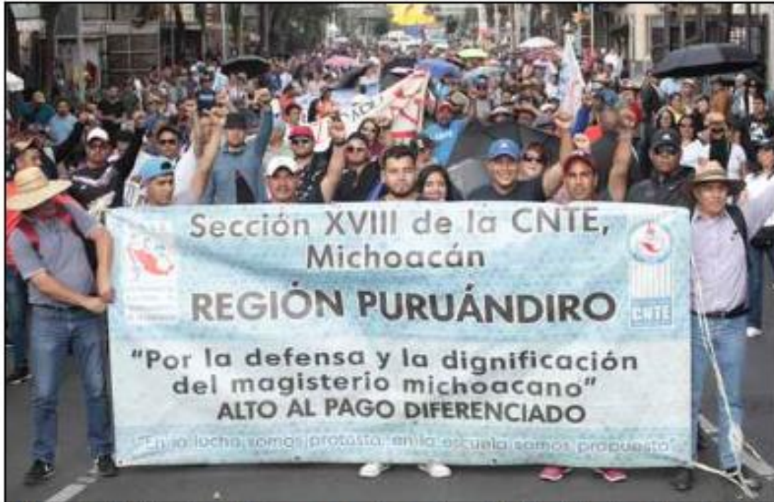
▲ Maestros de Michoacán advierten que se quedarán en la capital del país hasta que las autoridades respondan a sus demandas.