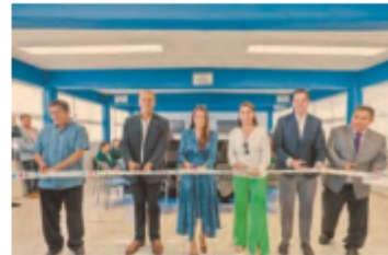
El complejo escolar en VNSA tendrá una inversión cercana a los 60 millones de pesos. Contará con preescolar, primaria y secundaria.

Posteriormente, la gobernadora inauguró la primera aula 4.0 en la Secundaria General No. 36 "Enseña Nacional" en Je-