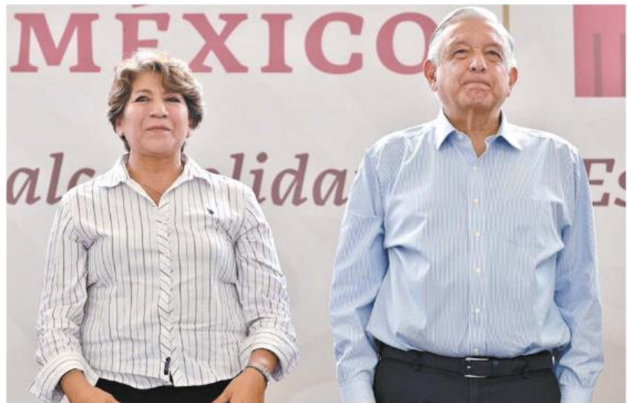
El presidente López Obrador y la gobernadora Delfina Gómez en Valle de Chalco.

Como parte de las actividades del tercer día de su gira de trabajo por el Estado de México, el mandatario nacional acentuó el respaldo que el gobierno federal brinda a Valle de Chalco y dio a conocer que, a través del Programa Jóvenes Construyendo el Futuro, también se otorgará más respaldo a las nuevas generaciones de esta demarcación.