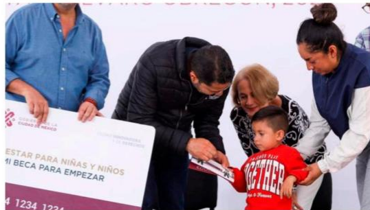
El jefe de Gobierno, Martí Batres encabezó la entrega de los apoyos.

El jefe de Gobierno, Martí Batres, destacó que dichos programas son universales, lo que significa que todos los estudiantes inscritos en la escuela recibirán estos