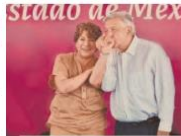
"La Cuarta Transformación está sanando heridas y demostrando que sí se puede vivir mejor", recalcó la gobernadora Delfina Gómez.

Garantizó que desde el comienzo de su mandato, el Gobierno del Estado de México contribuye a construir un país