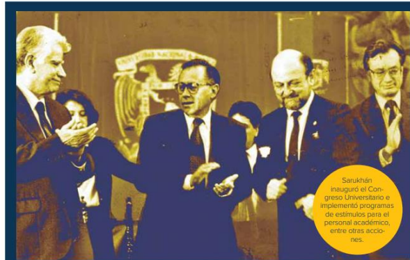
Sarukhán inauguró el Congreso Universitario e implementó programas de estímulos para el personal académico, entre otras acciones.

En su libro Desde el escritorio, el exrector narra como en una reunión con el entonces presidente Carlos Salinas de Gortari, quien le expresó su preocupación por el hecho de que las movilizaciones en contra de las cuotas afectarían el proceso electoral en Michoacán, debió confrontarse con Manuel Camacho Solís, entonces jefe del Departamento del Distrito Federal y quien, asegura, tenía un acuerdo con algunos de los