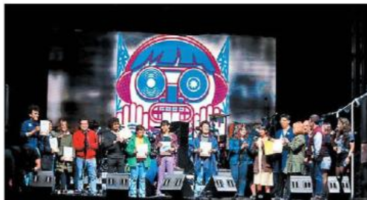
-Diversidad. Los jóvenes pudieron escuchar diversos estilos musicales.

En este marco, se entregaron los reconocimientos a las y los ganadores del certamen Nómada en sus diferentes categorías, quienes coincidieron en señalar que la música ha sido su motor, que les brinda la posibilidad de aportar algo de ellos, además de permitirles trabajar en equipo, en unión, y que no se puede concebir a la radio sin la música. 🎧