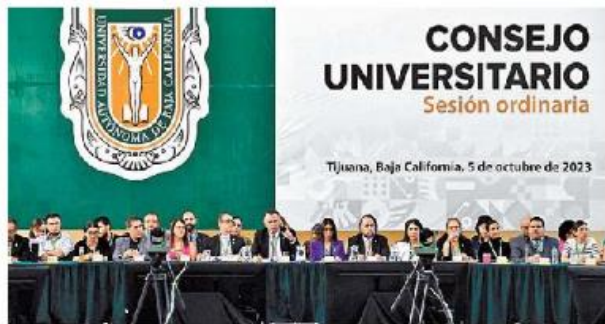
- Misión. Buscan asegurar la convivencia digna entre los integrantes de la institución.

A través de diversas acciones, este programa busca generar una