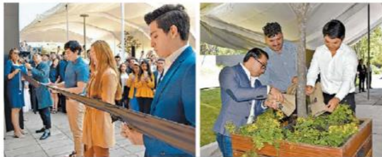
- Comienzo. Representantes estudiantiles cortaron el listón inaugural y plantaron el árbol fundador del plantel.