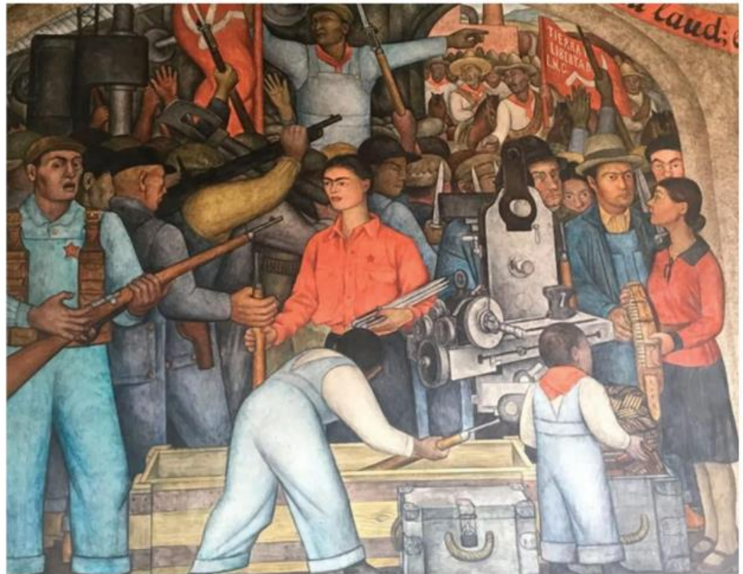
Entre los murales se encuentran piezas de Diego Rivera.

El edificio sede de la SEP ocupa una superficie de 35 mil 765 metros cuadrados y es un complejo arquitectónico que integra edificaciones: el Ex Templo y Ex Convento, las Dos Casas Intermedias y la Ex Aduana.