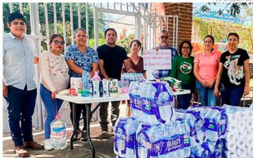
Cortesía del SNTE

También las secciones 19 de Morelos; 23 y 51, de Puebla; 17 y 36, del Estado de México; 9, 10, 11 y 60 de la Ciudad de México, reciben alimentos no perecederos, agua, pañales, medicinas no caducas, ropa en buen estado y artículos de limpieza • (Gerardo González Acosta)