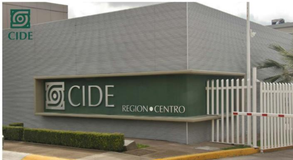
Abierto en 2012, el CIDE región Centro, en Aguascalientes, se especializa en estudios sobre violencia, tráfico de drogas y disminución de la pobreza en zonas de desastre.

Sin dar explicación pública del proceso jurídico o administrativo detrás de esta decisión, la dependencia dispuso de parte del patrimonio de este Centro Público de Investigación