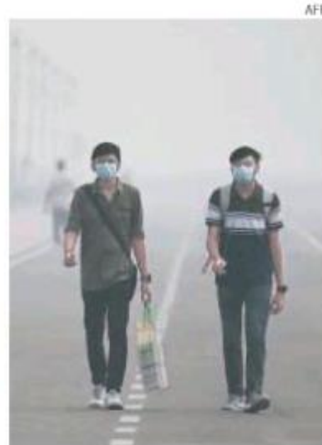
Es la más contaminada del mundo

"Como los niveles de contaminación siguen siendo muy elevados, las escuelas primarias permanecerán cerradas hasta el 10 de noviembre", anunció el ministro de Educación del estado de Delhi. AFP