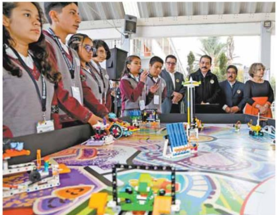
El gobierno mexiquense promueve estudios de robótica.

Al visitar la Escuela Secundaria Técnica No. 116 "Nezahualpilli" en Texcoco, presencié la demostración del "Proyecto de Innovación, diseño del robot y ejecución de misiones", en el marco de las actividades realizadas en "Octubre, mes de la ciencia".