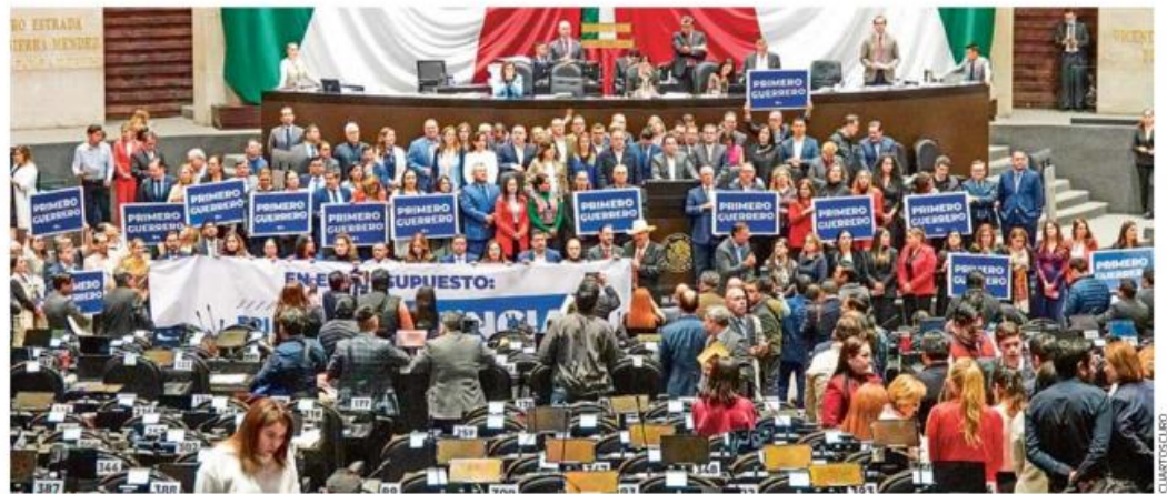
PRIORIDAD. La oposición reclamó la falta de recursos para Guerrero tras el desastre provocado por el huracán Otis.