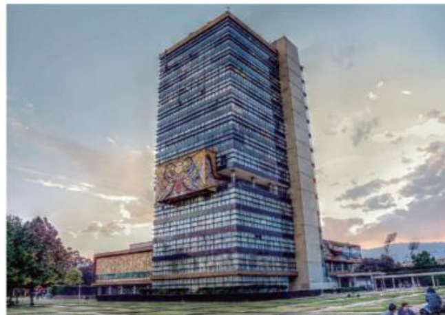
La UNAM afirmó que su imprenta sí está en funcionamiento. Especial

PESE A QUE tiene una imprenta en la que gasta más de 705 mil pesos mensuales en personal, la máxima casa de estudios, desde 1995, envía la gaceta universitaria a imprimir en talleres externos a los que ahora paga casi 500 mil pesos al mes