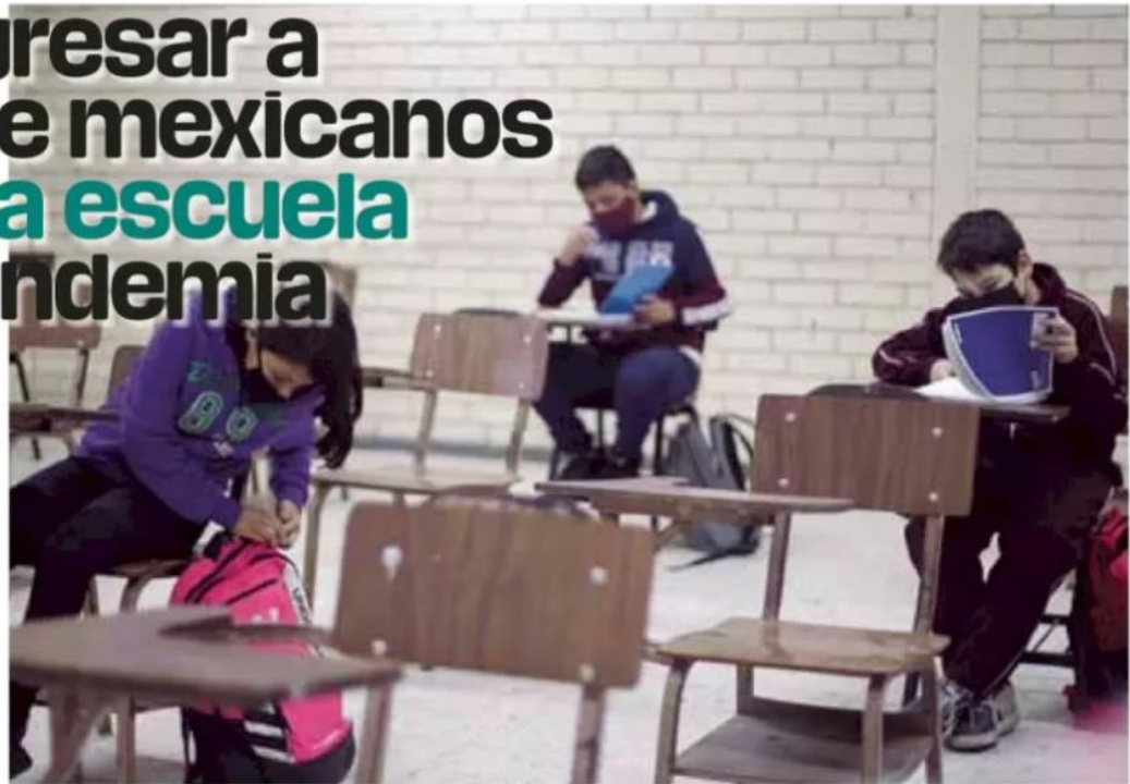
Deserción. En el caso de las mujeres, el abandono se debe a la falta de recursos, el matrimonio o el embarazo.

más álgido de la pandemia, el Inegi publicó los resultados de la Encuesta Nacional sobre Acceso y Permanencia en la Educación (ENAPE), donde, entre otras muchas cosas, se registró que el 28.6% de las personas que abandonaron sus estudios tenían pensado regresar a las aulas (25.8% hombres y 31.3% mujeres) y 15.5% (14.9% hombres y 16.2% mujeres) no sabrían si lo harían; sin embargo, dos años después, solo el 20% regresó.