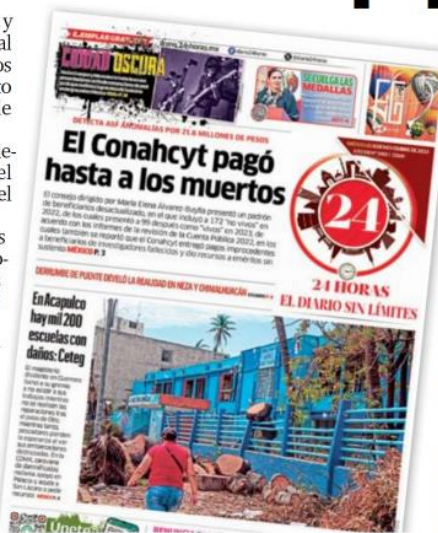
ASF. Ayer, 24 HORAS publicó que la Auditoría Superior de la Federación encontró diversas irregularidades en el Consejo.

Otro de los datos indica que, en 2021, cuando se llevó a cabo la última elección federal, con la renovación de la Cámara de Diputados y 15 gubernaturas, se transfirieron 268.3 millones de pesos desde el INE, los cuales también se utilizaron para fortalecer el Sistema Nacional de Investigadores.