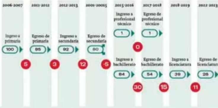
Modelo de tránsito escolar en el sistema educativo, modalidad escolarizada Periodo 2006-2007 a 2022-2023