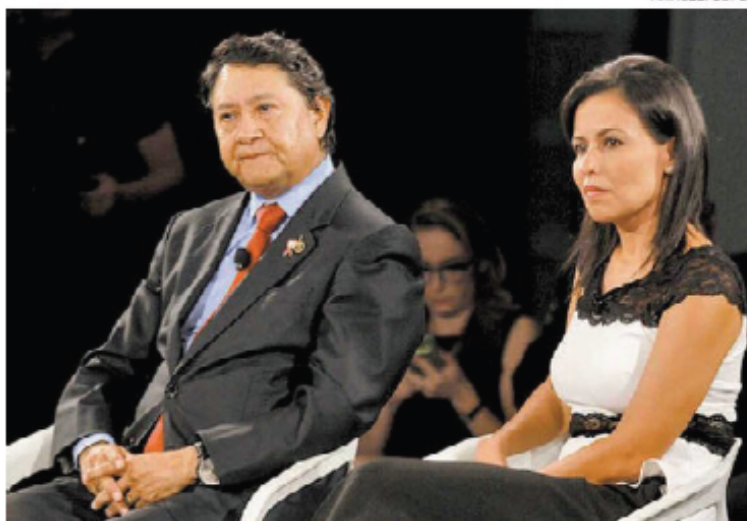
El director del Incan en el panel.

Además, dijo, para dimensionar la gravedad y el peso de la enfermedad en el país es preciso contar con un registro de cáncer poblacional y evitar, al mismo