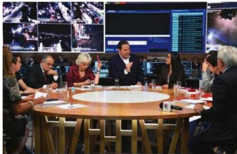
EL GOBERNADOR Eruviel Ávila (centro), ayer, durante el foro de opinión.

GOBERNADOR DEL EDOMEX asegura que no piensa en futurismos, sino en seguir dando resultados; destaca logros en seguridad, pero admite que son insuficientes