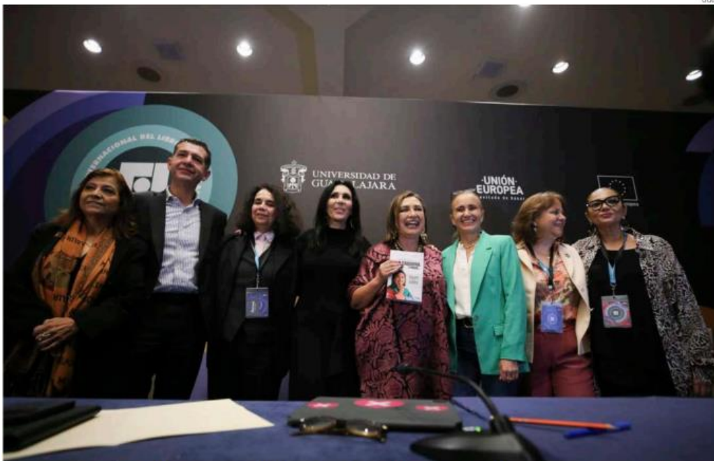
Las participantes del foro “Mujeres en el poder. El rumbo de México. Retos frente a la erradicación de la pobreza en México”, en la FIL de Guadalajara.

Se debe gestionar presupuesto para que esto sea realidad, añade en el foro “Mujeres en el poder. El rumbo de México”