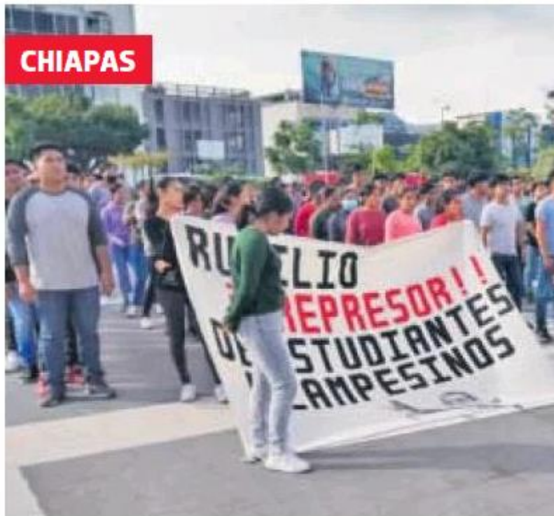
Normalistas de Mactumactzá piden cancelar las 95 órdenes de aprehensión contra sus compañeros