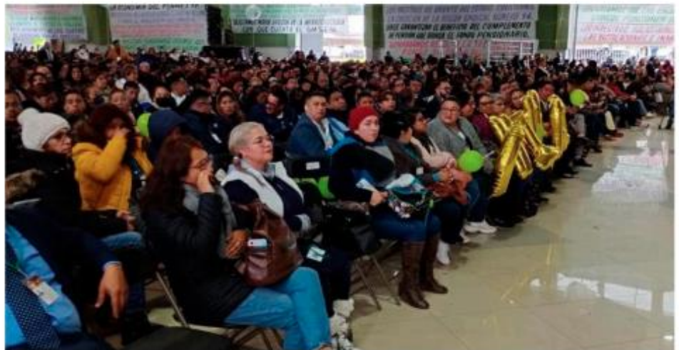
Los afectados crearon el Movimiento de Transformación Magisterial, con la finalidad de que con una mejor organización, la conformación de planillas se ejecute de manera ordenada y sólida.

Diversos grupos de maestros mexicanos han decidido pronunciarse en distintas manifestaciones y edificios de Gobierno luego de que el Sindicato de Maestros al Servicio del Estado de Méxi-