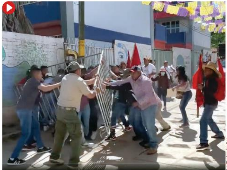
MAESTROS de la CETEG derriban las vallas de contención previo a la inauguración del CRIT en el municipio de Tlapa, Guerrero, el pasado domingo 26 de noviembre.

puede llegar a un lugar con una manifestación de unas 300 personas.