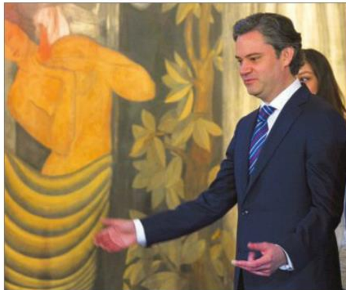
Aurelio Nuño ayer en las instalaciones de la Secretaría de Educación Pública.

Posteriormente recordó a los beneficiarios su responsabilidad: "sean grandes embajadores de México, ustedes estarán repre-