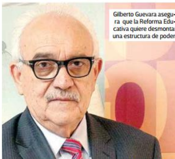
Gilberto Guevara asegura que la Reforma Educativa quiere desmontar una estructura de poder.

En su libro, Guevara Niebla enfatiza al menos cinco ideas clave: la Reforma Educativa no es punitiva ni busca