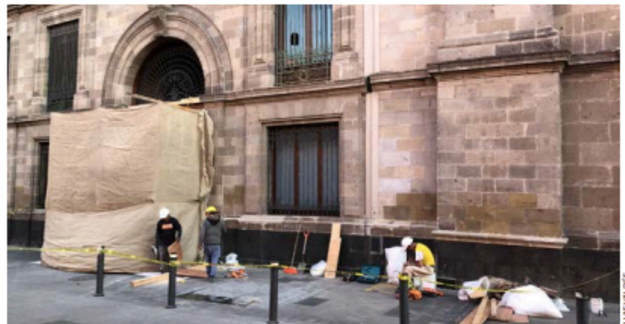
DAÑOS. Así se veía ayer la puerta que fue embestida por los normalistas el miércoles.

“¿Quién está conduciendo ese movimiento? (...) Entendemos la preocu-