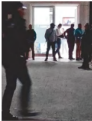
JALISCO. El gobernador lamentó el asesinato de tres mujeres.

La Fiscalía de Jalisco no ha proporcionado más información del crimen ni datos del detenido. No obstante, el gobernador Enrique Alfaro publicó en X: “Lo que sucedió en la UTEG, plantel Olímpica, es el terrible desenlace de una historia de terror difícil de explicar y que nos consterna como