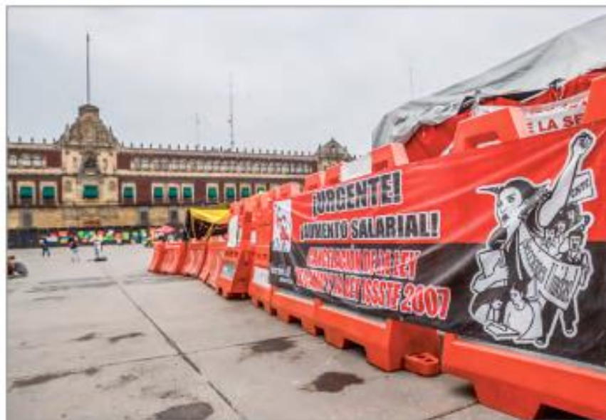
DEFINICIÓN. Los profesores informaron que decidieron concluir el paro de labores, por lo que volverán a las aulas, aunque mantendrán su presencia en la Plaza de la Constitución.

La Coordinadora Nacional de Trabajadores de la Educación (CNTE) definirá si levanta o no su plantón en el Zócalo este martes.