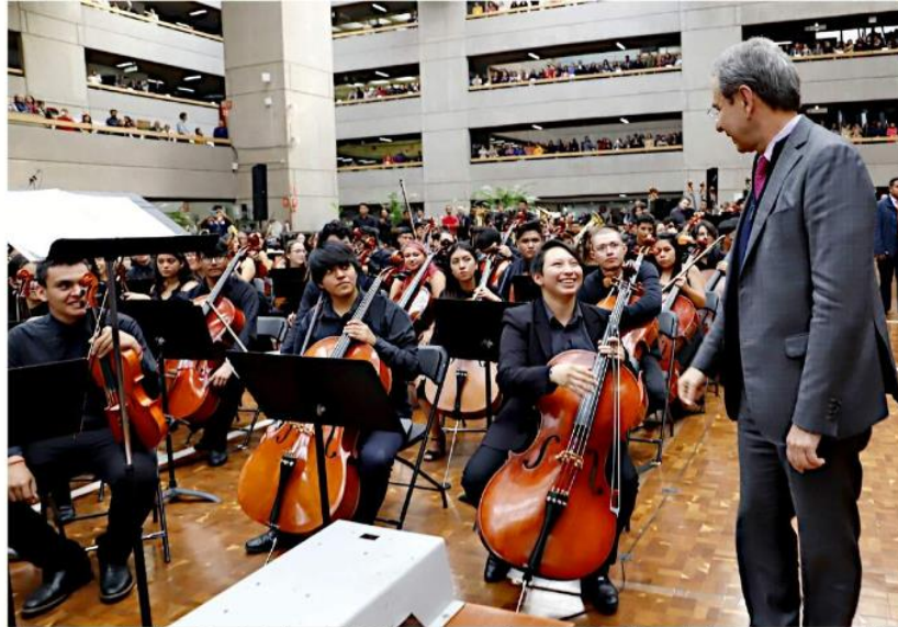
Las Orquestas de la Nueva Escuela Mexicana (ONEM) fueron presentadas por la SEP en 2019; un año después serían suspendidas.

“Nos vemos en la necesidad de aplazar el programa de orquestas hasta nuevo aviso, por lo que a partir de hoy estamos en pausa hasta que