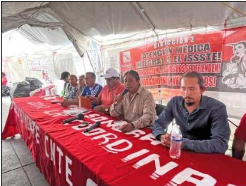
▲ La dirigencia de la CNTE anunció que con el receso del paro no terminan su movilización.