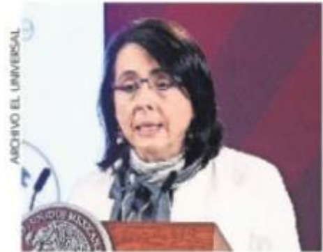
María Elena Álvarez-Buylla.

:::: Tras seis años de incertidumbre y ataques, un suspiro de alivio de la comunidad científica se escuchó al unísono este jueves, cuando Claudia Sheinbaum anunció que en su gobierno habrá Secretaría de Ciencias, Humanidades, Tecnologías e Innovación, con Rosaura Ruiz como titular. Muchos celebraron la noticia, incluso en X un usuario bromeó con celebrar el fin de Conahcyt y la salida de su directora, María Elena Álvarez-Buylla, en el Ángel de la Independencia. Algunos expresaron su esperanza de que con este movimiento la ciencia sea tomada con seriedad; otros esperan que esto modifique la detestada nueva Ley de Ciencia; mientras que los más escépticos hacen un llamado a permanecer vigilantes. Por otra parte, el estruendoso silencio de Álvarez-Buylla ante la noticia de la desaparición del Consejo y su transformación a Secretaría fue una reacción que se hizo notar. Aunque la funcionaria se curó en salud el domingo pasado, cuando anunció que regresa a su labor académica, y anoche, cuando le echó porras a Claudia Sheinbaum en un hilo de X. Una vez que el peso del viejo Conahcyt empieza a aligerarse, ahora resta estar pendiente de qué sigue para el sector ciencia, si realmente se tratará de un sexenio reparador o más de lo mismo.