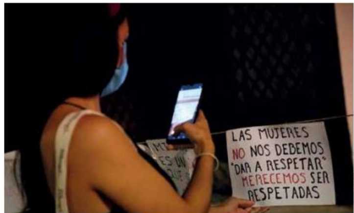
Existen prácticas de este tipo de abuso que aún no se reconocen a pesar de que forman parte de la violencia estructural de género, pero que al ocurrir dentro del mundo virtual no se identifican como tal.

En la UAM se exploraron tres categorías de análisis: los que han vivido o ejercido violencia; quienes no lo han hecho o vivenciado, y quienes no saben con certeza lo que es. De las personas que manifestaron haber vivido o ejercido alguna de esas situaciones, son muchas más las mujeres que lo identifican que los varones; esto porque ellas resultan más proclives a sufrirlas.