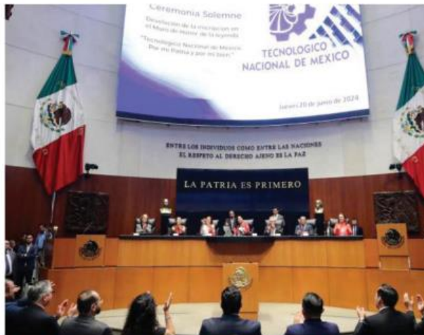
Ceremonia solemne en el Senado para inscribir, en el Muro de Honor y con letras doradas, la leyenda: “Tecnológico Nacional de México, por mi Patria y por mi bien”.

“La tasa de abandono escolar en la educación media supe-