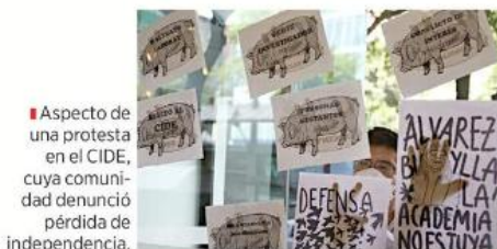
Aspecto de una protesta en el CIDE, cuya comunidad denunció pérdida de independencia.

Conahcyt, con ‘H’, que ya no existe, porque va a haber una Secretaría de Estado, entonces hay que arreglar la ley porque el marco institucional cambia”, advierte.