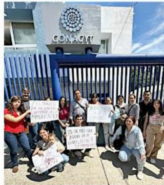
Las protestas marcaron la gestión de Álvarez-Buylla; aquí jóvenes en Jalisco reclaman sus becas.