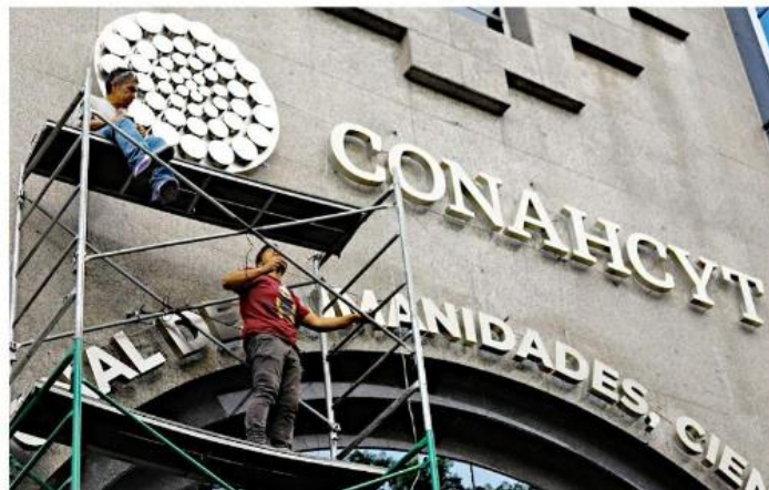
De Conacyt pasó a Conahcyt, con H de humanidades, y ahora la dependencia será la Seciht.

“Esta ley, además, está en torno a la existencia de un