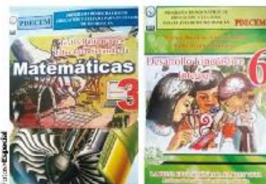
LIBROS Matemáticas 3, de secundaria (izq.), y Desarrollo Lingüístico 6, de primaria, de la CNTE.

FORMAN PARTE del "Programa de Educación y Cultura" de los maestros radicales; "su plan es un mamotreto ideológico", dice Mexicanos Primero