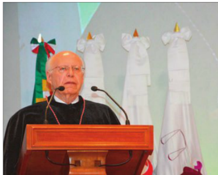
José Narro Robles, secretario de Salud, fue investido con el el Doctorado Honoris Causa por la Escuela Judicial del Estado de México.

En este contexto, Narro Robles enfatizó que las reformas estructurales impulsadas por el gobierno del presidente Enrique Peña Nieto, como las relacionadas con la impartición de justicia "contribuirán al avance del Estado de derecho en el país y a derrotar la impunidad y la injusticia", en este mismo sentido, abundó, apuntan las leyes recientemente aprobadas para combatir la corrupción.