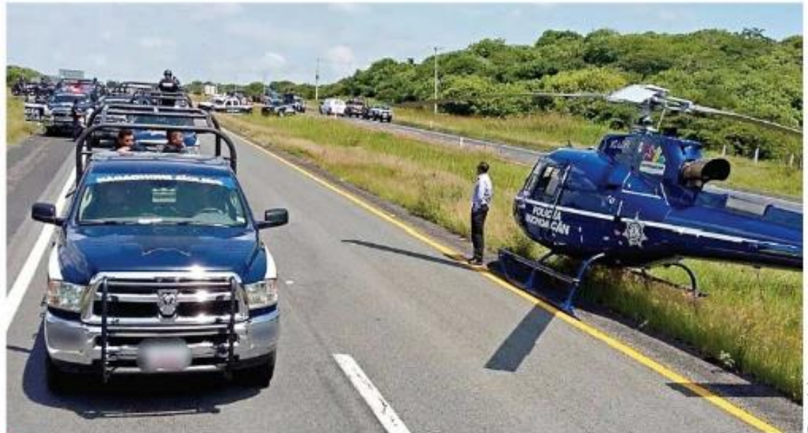
■ Patrullas y un helicóptero de la Policía de Michoacán implementaron ayer un operativo para evitar más actos vandálicos de normalistas en la entidad.

El operativo incluye la vigilancia de puntos estratégicos de la red ferroviaria, don-