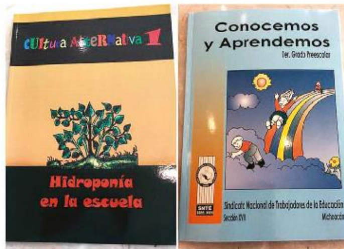
Libros usados en preescolar para enseñar hidroponía y actividades de aprendizaje.

Los libros de educación alternativa que maneja la CNTE en esta entidad se agrupan en siete áreas de conociemien-