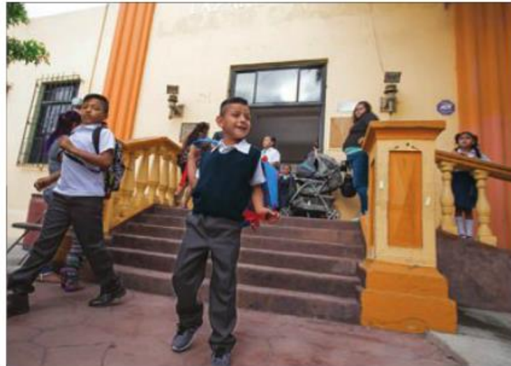
Escena en Tijuana, durante el regreso a la realidad escolar.

Y en el caso de Oaxaca inició normalmente el ciclo 47 por ciento de las escuelas, mientras que en Chiapas esto ocurrió en