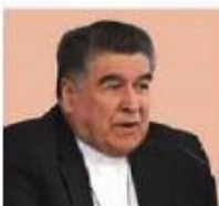
Felipe Arizmendi Obispo de Chiapas, el 11 de julio pasado

“Siento que el Gobierno está usando, según yo, mal la terminología, yo siento y pienso que no es una reforma educativa, es una reforma laboral”