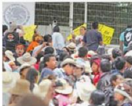
Alzan la voz. Un grupo de empresarios protestaron en el Auditorio Guelaguetza.

“Nos estamos reuniendo con nuestros presidentes de las cámaras afectadas para realizar una evaluación sobre los daños y tomar acciones en conjunto, ante las obstrucciones que permanecen en diversas carreteras y que siguen provocando severos daños a las economías de las entidades,