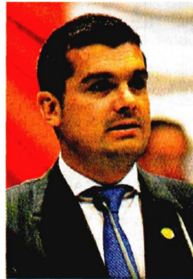
EL DIPUTADO del PAN hizo estos señalamientos luego de que la Arquidiócesis de México criticó en días pasados las reformas estructurales.

“Tiene que haber prudencia, sí, tienen que cuidar mucho lo que dicen porque si ellos son líderes de opinión deben de tener sus reservas en algunos temas”, insistió.