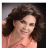
Ivonne Ortega Pacheco