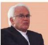
Raúl Vera Obispo de Saltillo, el 26 de junio pasado

“Desgraciadamente tenemos en las reformas estructurales una privación de los derechos de los ciudadanos. La privación del derecho a la educación pública que afecta a los educadores, que los deja sin trabajo”