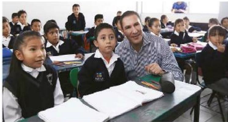
EL GOBERNADOR Rafael Moreno Valle en la primaria Benito Juárez, ayer.

En la escuela, Moreno Valle dijo: Me da gusto poder entregarles esta escuela que llevaba décadas sin mantenimiento y hoy la vemos renovada. Se destinaron 5 millones de pesos para cambiar los baños, cancelería, impermeabilizarla y pintarla.