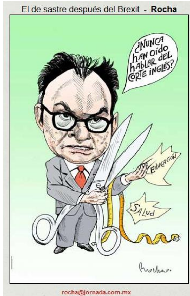
El de sastre después del Brexit - Rocha