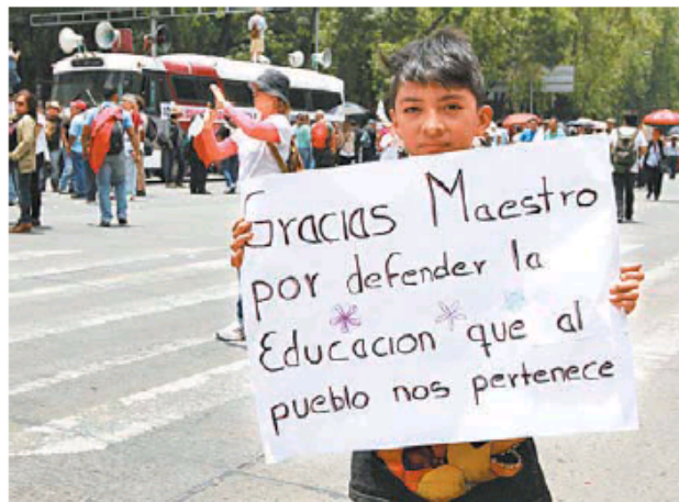
Respalda 64% el despido de los docentes faltistas.

"Aquí es importante mencionar cuáles son los aspectos que los ciudadanos están considerando: por un lado, que no han visto un avance de la reforma educativa, pero, por otro lado, el abuso por parte de estos grupos radicales, de estos seudomaestros, y aquí, más que responder, habría que preguntarnos quién está detrás, quién los está patrocinando, porque queda claro que están buscando desestabilizar al gobierno", pun-