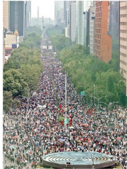
■ Unas 40 mil personas se movilizaron ayer en Paseo de la Reforma, según datos del Gobierno de la Ciudad de México.

El verdadero peligro, subrayó, son la corrupción y el autoritarismo de los gobernantes, por lo que llamó a derrocar al actual régimen de forma pacífica.