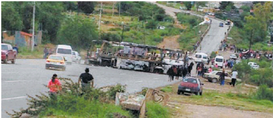
Los principales afectados son los habitantes de las poblaciones marginadas.

Exigen cuotas que superan las de una caseta