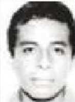
Normalista de Ayotzinapa